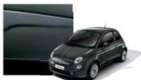
735 Grigio Carrara Pastello