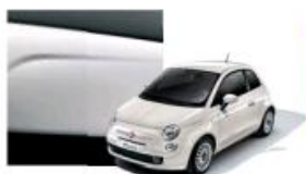
268 Bianco Gelato Pastello