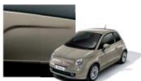
231 Beige Cappuccino Pastello