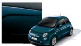
687 Blu Dipintodiblu Metallizzato