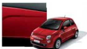
111 Rosso Passione Pastello