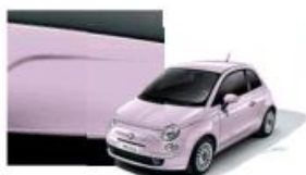
182 Rosa Diva Metallizzato