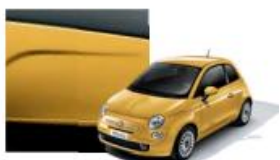
712 Giallo Sole Pastello