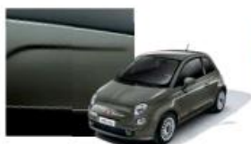
372 Grigio Colosseo Metallizzato