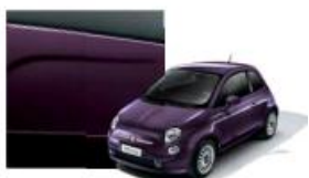
528 Viola Dolce Metallizzato