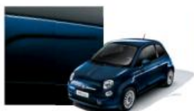
407 Blu Mediterraneo Metallizzato