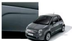
695 Grigio Pompei Metallizzato