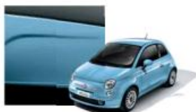
952 Azzurro Volare Pastello